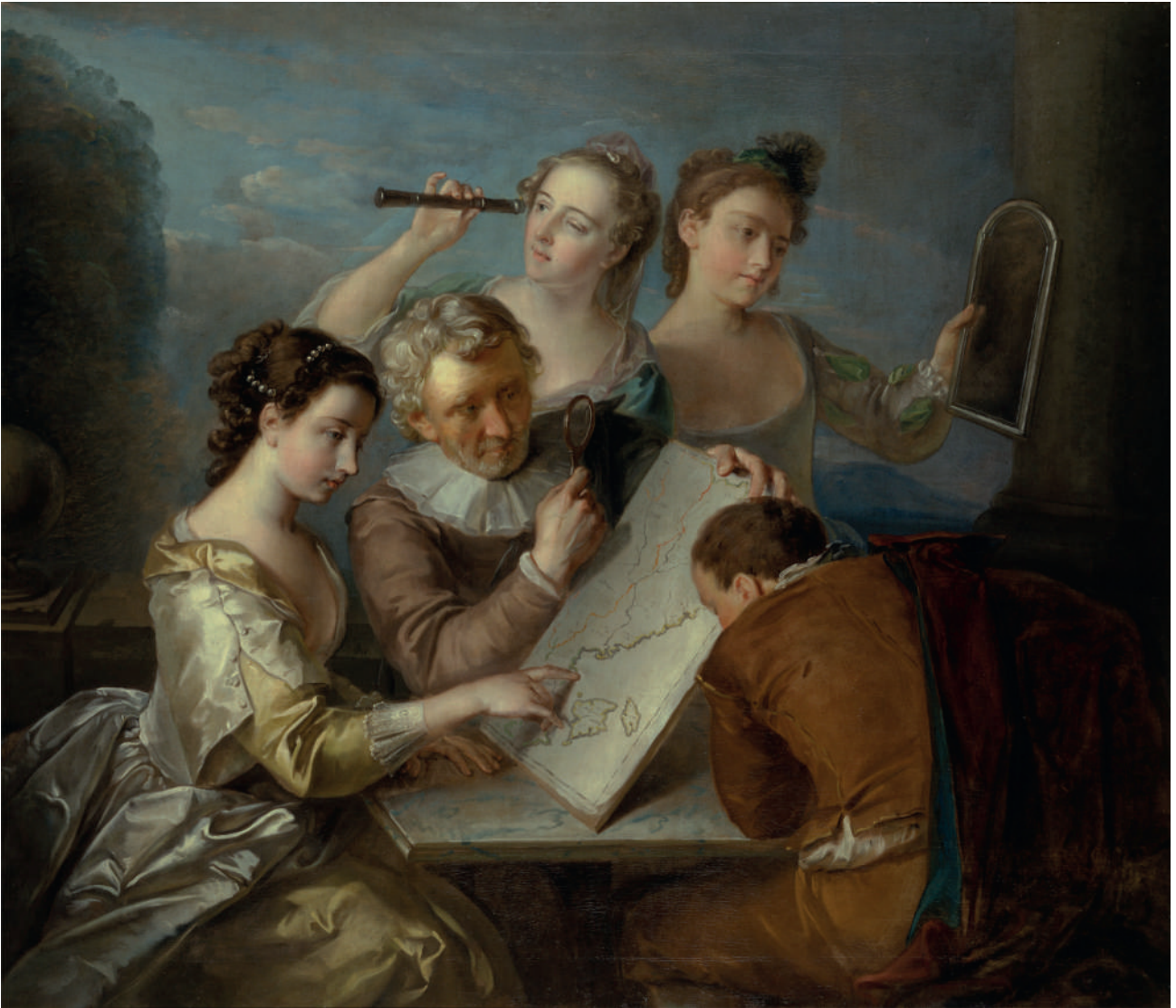
Figure 2 : « Le sens de la vue », Philippe Mercier, entre 1744 et 1747, huile sur toile, Yale Center for British Art.