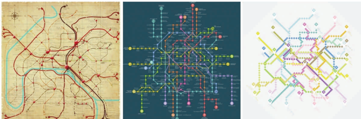
Figure 1 : Exemples de cartes de métro du concours Check My Map.