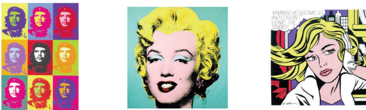
Figure 3 : Sources d'inspiration du mouvement Pop Art.