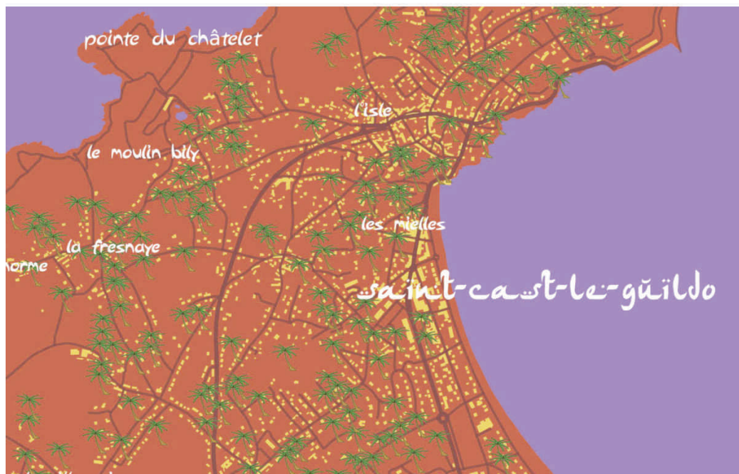
Figure 7 : Exemple d'une carte style oriental (Kasbarian et Audusseau, 2012).