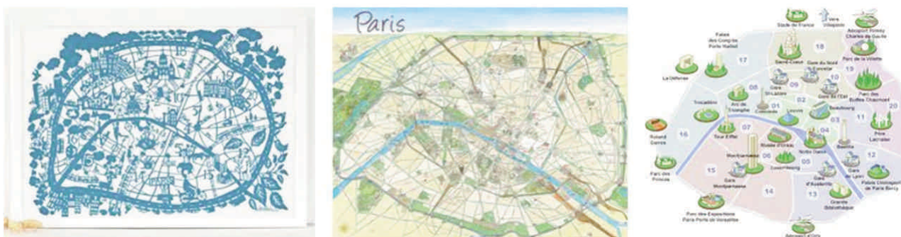
Figure 2 : Exemples de cartes de Paris.