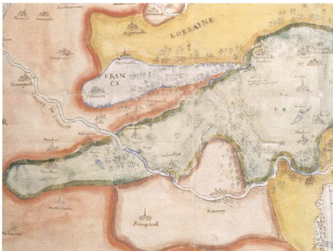
(Fig. 3) Extrait de la carte des limites de la Franche Comté, en pourpre les contestations avec le Lorraine, début du XVIIe siècle. Arch. dép Côte d'Or