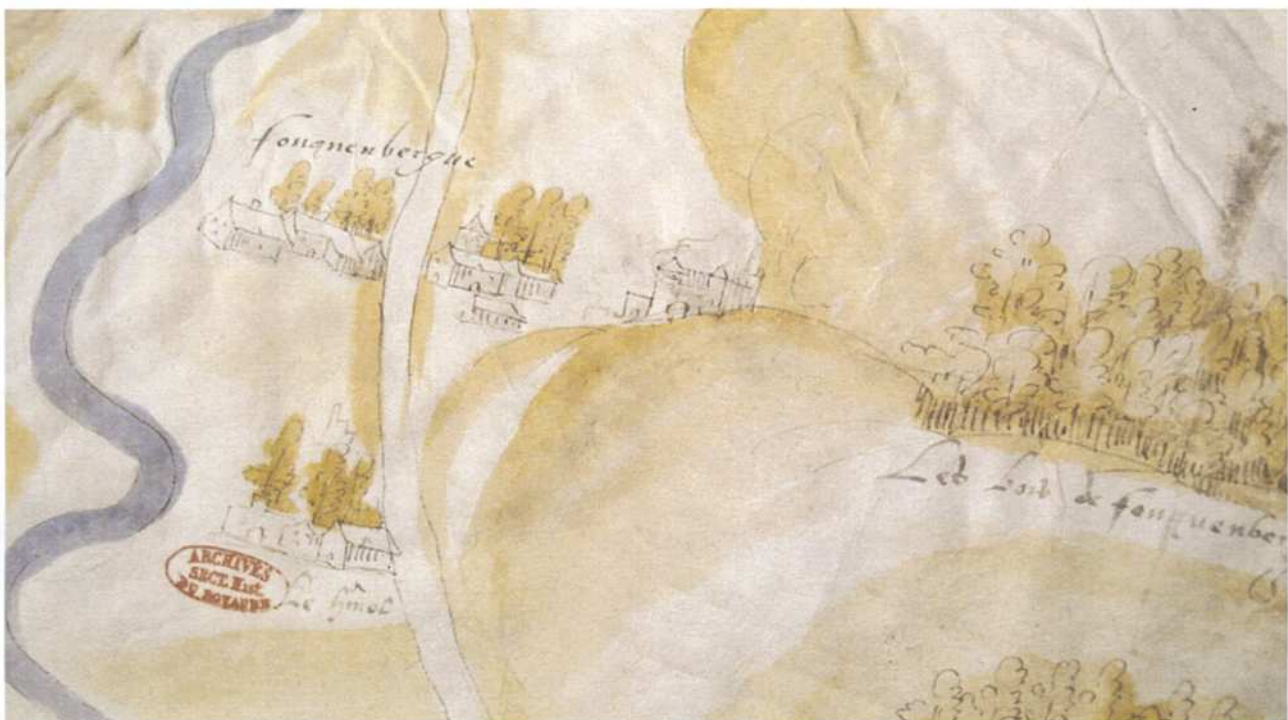
(Fig. 7) Le Hamel sur la 11e figure du dossier des Arch. nat., 1560