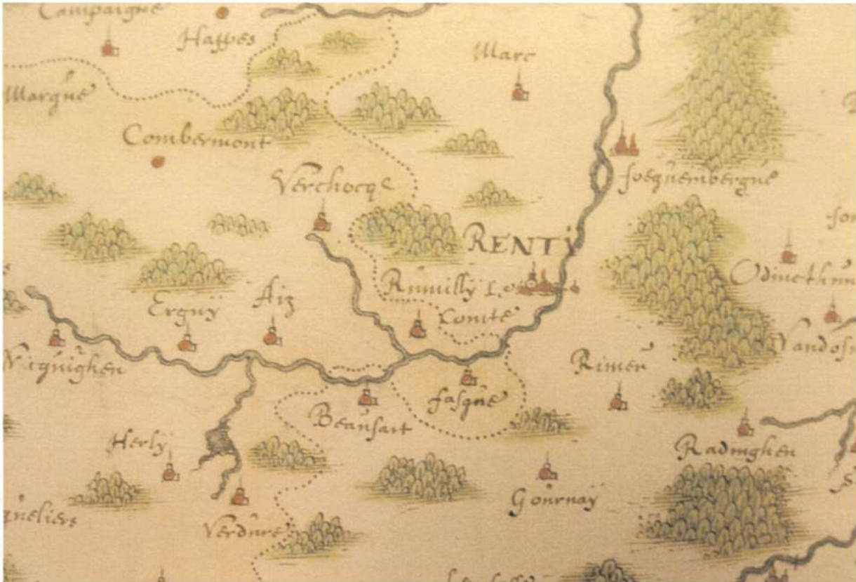
(Fig. 9) La vallée de l'Ae et la frontière de l'Artois selon la France, 1602.