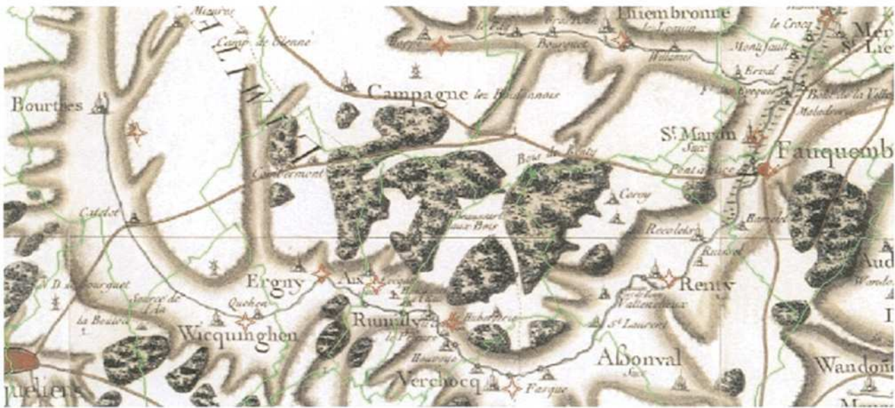
(Fig. 10) La vallée de l'Aa et la frontière de l'Artois sur la carte de Cassini avec ajout des limites des communes en vert. Laboratoire de démographie historique de l'EHESS