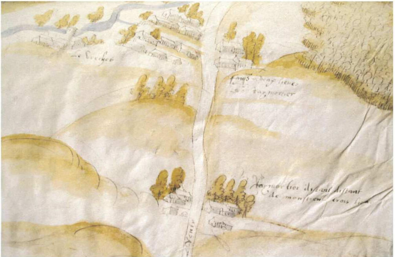
(Fig. 8) Fasque et Verchocq sur la 11e figure du dossier des Arch. nat., 1560