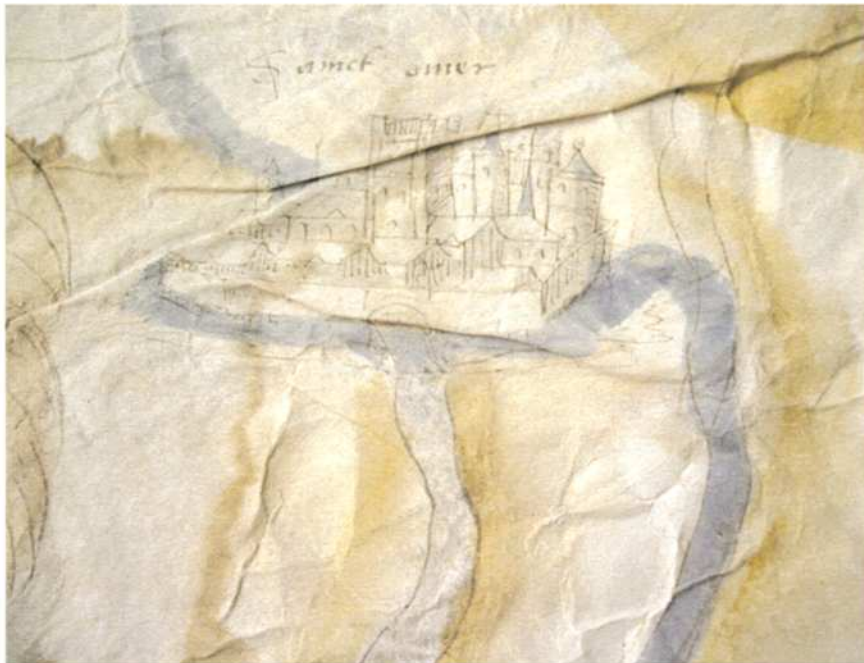
(Fig. 6) Saint-Omer sur la 11e figure du dossier des Arch. nat., 1560